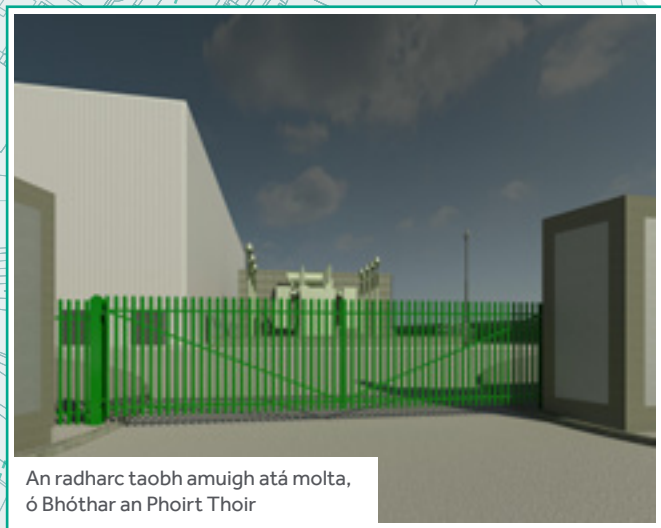
An radharc taobh amuigh atá molta, ó Bóthar an Phoirt Thoir