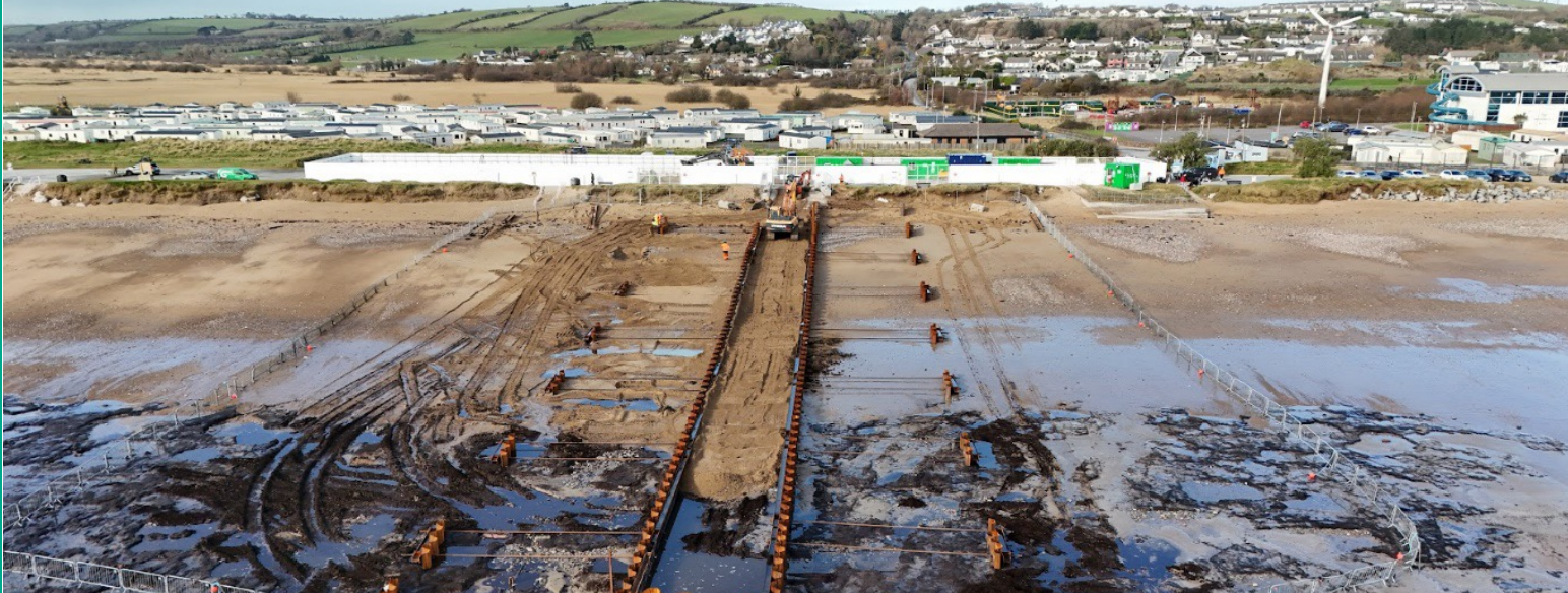
Tógáil an Chófradhamba ag Trá an Chaisleáin Chria, Feabhra 2025.