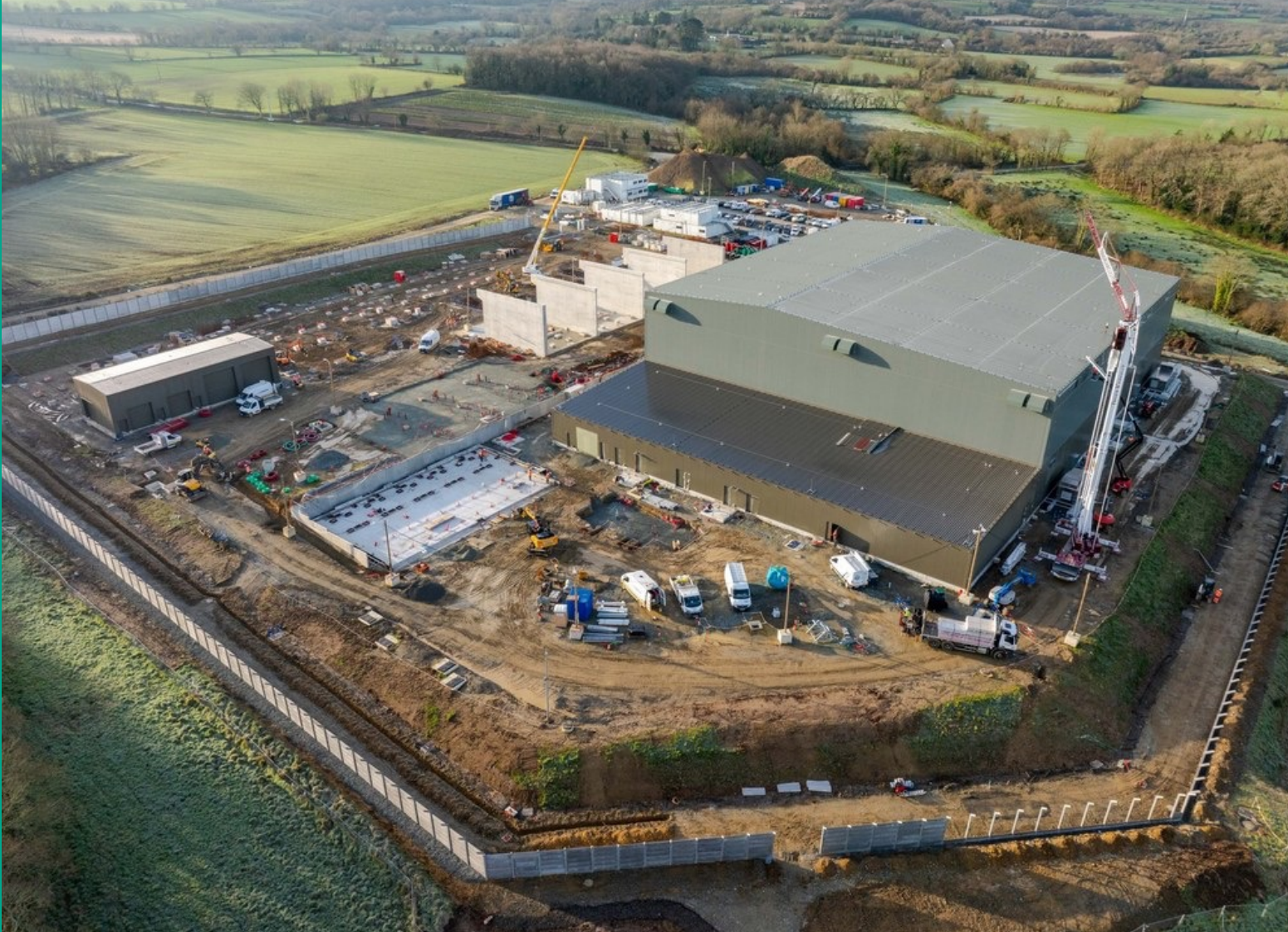
Oibreacha ag dul ar aghaidh ag láithreán an stáisiúin tiontaire Ar Merzher gar d'fhostáisiún La Martyre (Finistère), an Fhrainc.