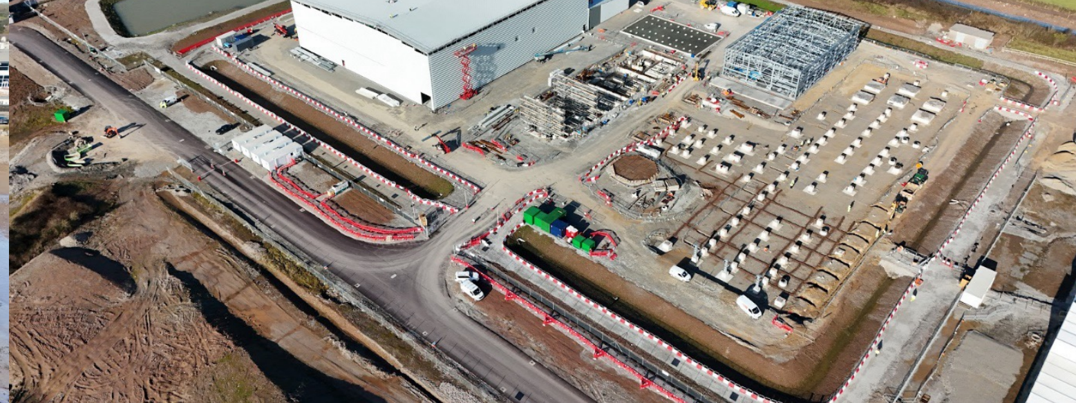
Dul chun cinn na n-oibreacha ag láithreán an stáisiúin tiontaire, Baile Adaim.