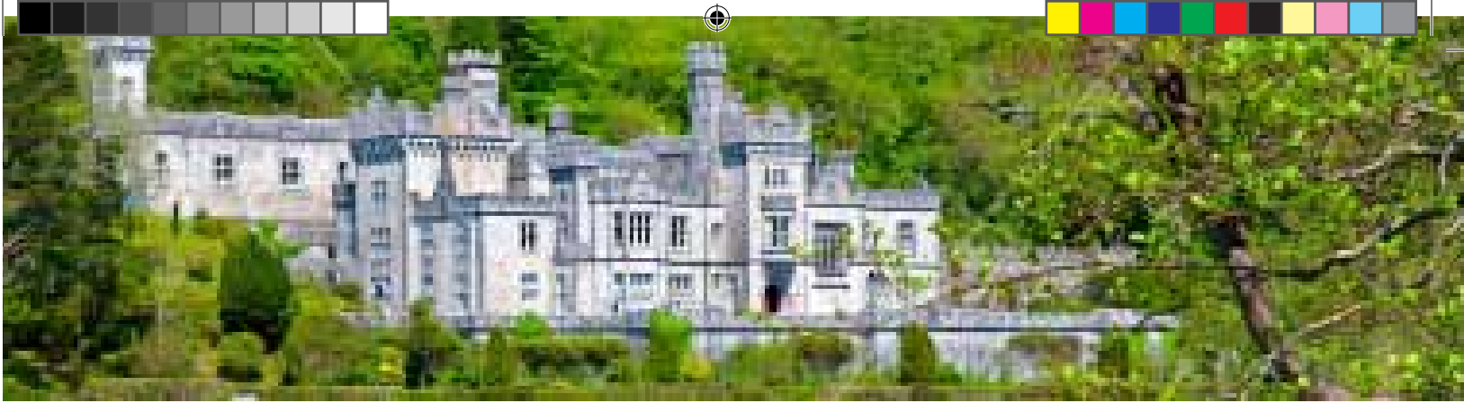
Kylemore Abbey, Co. Galway