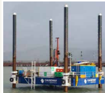
Jack-up Barge Suirbhéanna Geoiteicniúla

Má tá aon cheist nó ábhar imní agat, is féidir leat teagmháil a dhéanamh lenár nOifigeach Idirchaidrimh don Phobal: