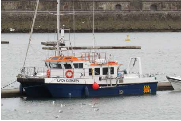
Lady Kathleen Suirbhéanna Geoifisiceacha, Comhshaoil agus Meit-Aigéin

Beidh na suirbhéanna sin ar siúl i gCuan Bhaile Átha Cliath ó earrach 2026 go samhradh 2027. Beidh na soithigh seo a leanas i mbun na suirbhéanna is gá: