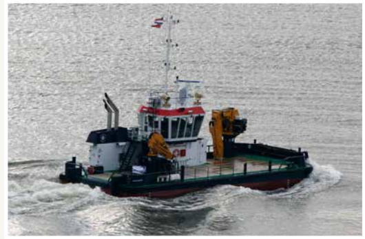
Ocean Energy Multicat Suirbhéanna Geoiteicniúla