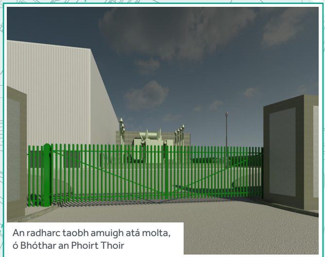
An radharc taobh amuigh atá molta, ó Bóthar an Phoirt Thoir